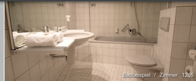
Badbeispiel / Zimmer 1205

Seit 1510 gehört das Hotel Brusttuch ein Juwel nieder-sächsischer Steinmetz-, Zimmermanns- und Holzschnitzkunst zu den beliebtesten Sehenswürdigkeiten Goslars. Dieses historische Patrizierhaus direkt im Zentrum der über tausend Jahre alten Kaiserstadt bietet seinen Gästen individuelles Wohnen hinter historischen Mauern. Möchten Sie noch mehr über unser Haus und deren Geschichte erfahren, besuchen Sie bitte unsere Internetseite: www.brusttuch.de