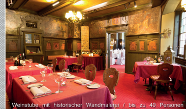
Weinstube mit historischer Wandmalerei / bis zu 40 Personen