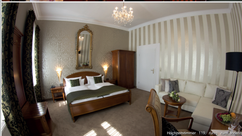
Hochzeitzimmer 119, ruhig zum Innenhof