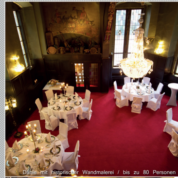
Dahle mit historischer Wandmalerei / bis zu 80 Personen