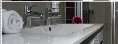
Zimmer 119, Badbeispiel mit Eckbadewanne