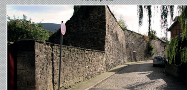
Goslars alte Stadtmauer