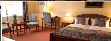
Zimmer 239, ruhig zum Innenhof

Bikerarrangement: GPS Koordinaten vom Kaiserworth 51.903202, 10.429373