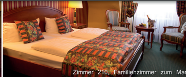
Zimmer 210, Familienzimmer zum Markt